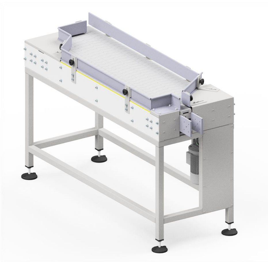
TAVOLA SEPARATRICE TIPO: Z-5202

La tavola separatrice Z-5202 fa parte della linea di produzione di bombolette spray. La funzione principale della tavola separatrice è quella di separare le bombolette spray accumulate sul tavolo di carico e di formare 2 file separate per fornire bombolette alle due macchine autonome per la successiva lavorazione.